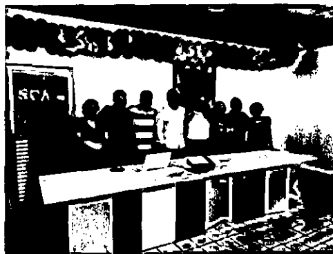
Foto da Equipe que participou da mesa de abertura