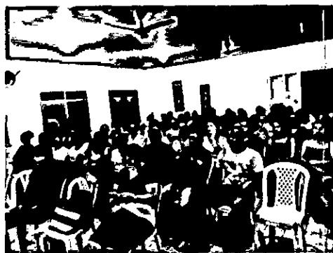
Participantes do Seminário