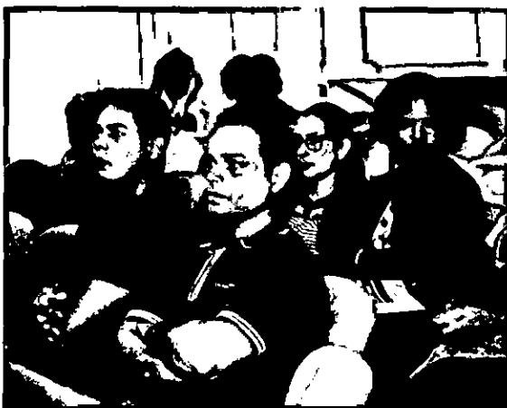
Participantes do Seminário Final