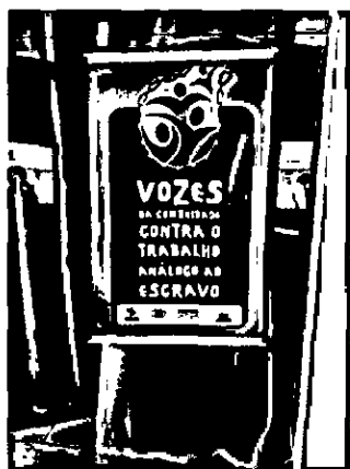
Banner do Projeto