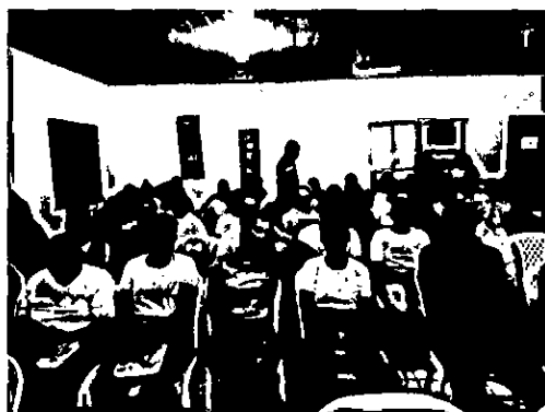
Participantes do Seminário Local de Devolutiva do Diagnóstico