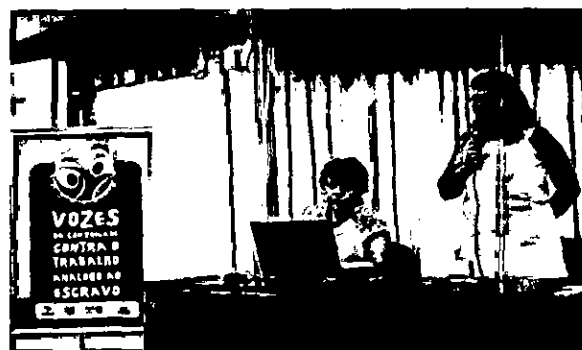
Representantes da AVANTE no Seminário de encerramento