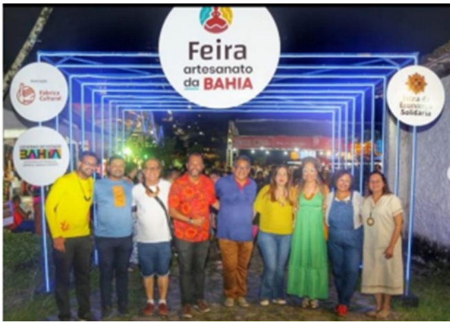
Registro fotográfico: Original Week