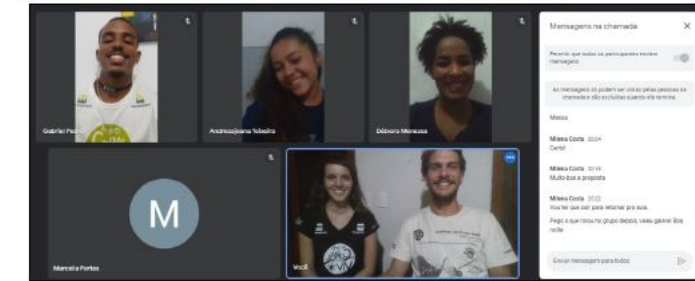
IMAGEM 05: FOTO E PRINT DO EVENTO DE CONSUMO RESPONSÁVEL REALIZADO NO 4º TRIMESTRE.