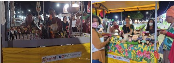
IMAGEM 08: FEIRA PÚBLICA DE ECONOMIA SOLIDÁRIA PORTO SEGURO.