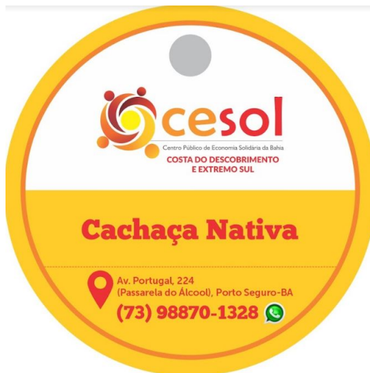
IMAGEM 01: TAG CACHAÇA NATIVA.

Dentre os documentos comprobatórios encaminhados, estão tags desenvolvidas para diversos EES que ainda não tem identidade visual própria, próximo passo da assistência técnica no âmbito da comunicação.