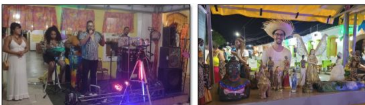
IMAGEM 11: I ARRAIÁ DA ECONOMIA SOLIDÁRIA, EM PORTO SEGURO.