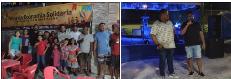
IMAGEM 09: FEIRA PÚBLICA DE ECONOMIA SOLIDÁRIA DE COROA VERMELHA. FONTE: CESOL COSTA DO DESCOBRIMENTO E EXTREMO SUL, 2022.