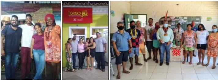
IMAGEM 14: VISITA TÉCNICA VILA CRIATIVA / ASSOCIAÇÃO DOS BARRAQUEIROS E ASSOCIAÇÃO MINHA CASA MINHA VIDA / ALDEIA VELHA ARRAIAL D'AJUDA - BA.