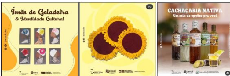
IMAGEM 04: CARDS PUBLICADOS NO INSTAGRAM DO CESOL.

Reiteramos que o Cesol Costa do Descobrimto e Extremo Sul vem desenvolvendo um trabalho de comunicação relevante, contando com assessoria de imprensa e, conseqüentemente, acessando os canais de comunicação na imprensa local e regional: TV, rádio, jornais impressos e blogs.