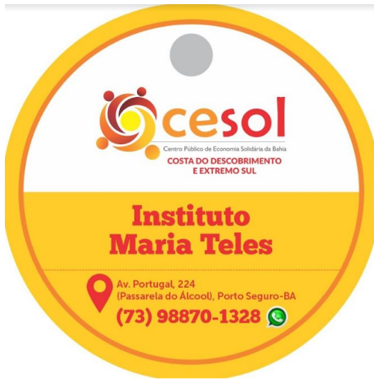
IMAGEM 02: TAG INSTITUTO MARIA TELES.

Portanto, é possível reconhecer que o trabalho desenvolvido pela equipe técnica do Cesol Costa do Descobrimto e Extremo Sul tem sido apropriado para estabelecer: comércio justo, qualificação, rotulagens com estratégias de marketing, a valorização da tradição e das técnicas de produção dos empreendimentos econômicos solidários.