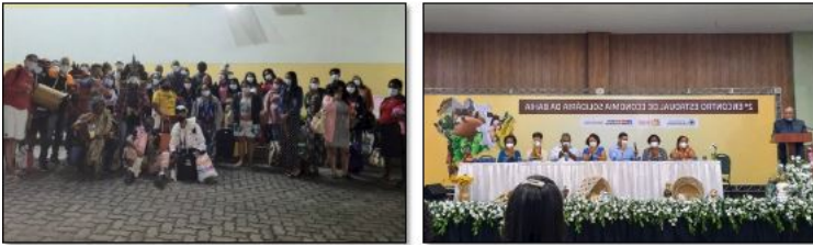
IMAGEM 12: 2º ENCONTRO ESTADUAL DE ECONOMIA SOLIDÁRIA DA BAHIA, EM SALVADOR. FONTE: CESOL COSTA DO DESCOBRIMENTO E EXTREMO SUL, 2022.