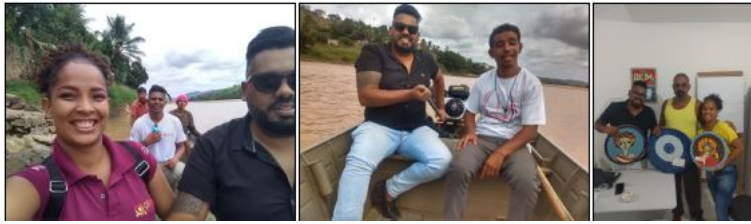
IMAGEM 13: VISITA TÉCNICA ALDEIA PATAXÓ ENCANTOS DA PATIOBA / CASA OLIVEIRA.