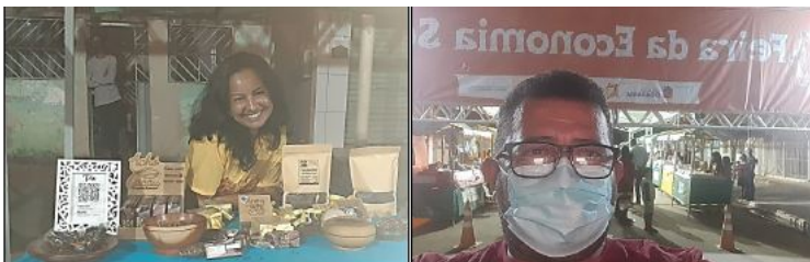
IMAGEM 10: FEIRA PÚBLICA DE ECONOMIA SOLIDÁRIA DE TEIXEIRA DE FREITAS.