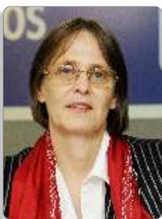
Laís Abramo Diretora da Organização Internacional do Trabalho (OIT) Escritório de Brasília

“O FUNTRAD é um instrumento importante para o avanço e a efetiva implementação do Programa Bahia de Trabalho Decente, na medida em que possibilita direcionar recursos a projetos e iniciativas que contribuam para a obtenção de resultados definidos como prioritários pelos atores que estão comprometidos desde 2007 com essa iniciativa pioneira do Estado da Bahia”