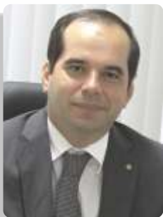
Alberto Balazelo Procurador-chefe do Ministério Público do Trabalho (MPT) na Bahia

“Tendo projetos bem fiscalizados pelo conselho gestor e bem executados, o FUNTRAD vai aproximar a reparação dos danos daqueles que foram atingidos e no local onde o dano aconteceu. São esses projetos que irão de fato permitir o acolhimento de pessoas resgatadas do trabalho escravo, a aprendizagem, a erradicação do trabalho infantil e tantas outras ações necessárias para atingirmos um cenário de efetivo trabalho decente”