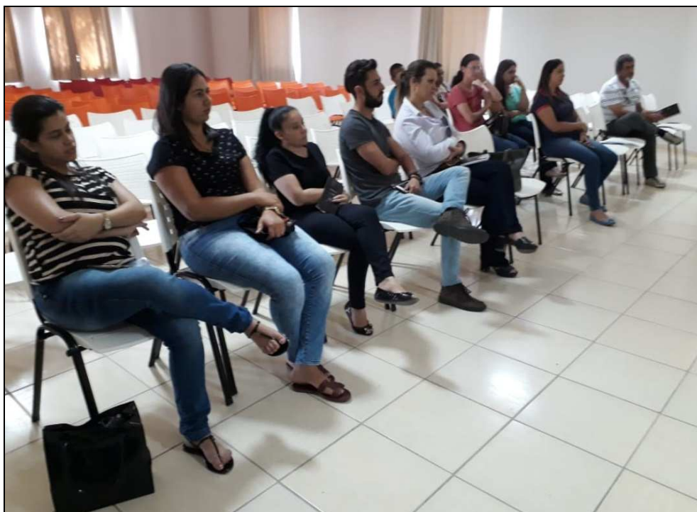
Presença de representantes locais