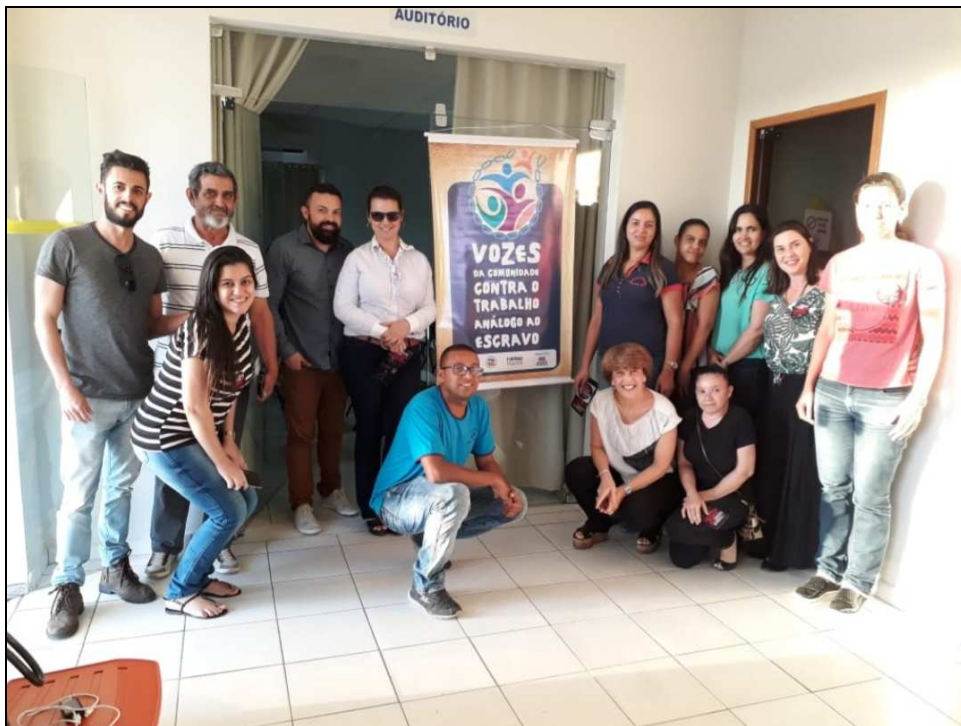
Registro dos participantes do Seminário Local em Aracatu